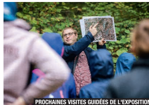
PROCHAINES VISITES GUIDÉES DE L'EXPOSITION

Une programmation à découvrir sur : www.culture.paysvoironnais.com