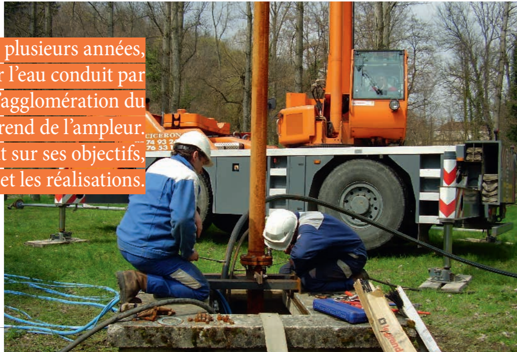
Agir pour sécuriser la ressource en eau

Engagé voilà plusieurs années, le plan pour l'eau conduit par la Communauté d'agglomération du Pays Voironnais prend de l'ampleur. On vous dit tout sur ses objectifs, les moyens mobilisés et les réalisations.