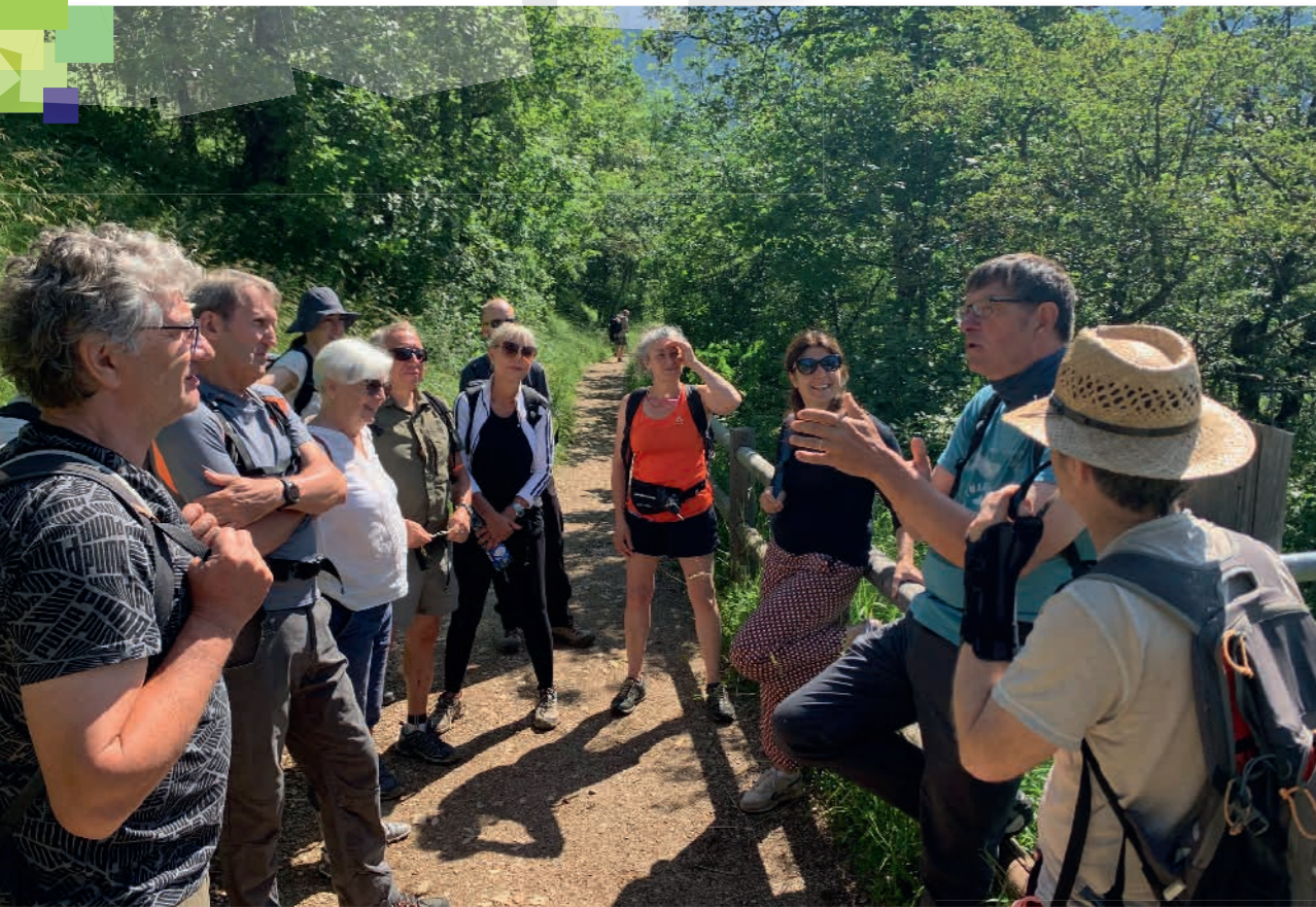
Sortie collective à Chalais, échange autour de la forêt.