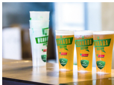
Le rugby s'essaie aux éco-cups

Pour remplacer les gobelets jetables destinés aux sportifs, vous pouvez les inviter à venir avec leur propre gourde (ou proposer des gourdes non datées et consignées) ; mettre en place des gobelets réutilisables consignés (prévoir éventuellement des porte-gobelets) ; ou encore installer des fontaines ou rampes à eau . Pour le public accueilli lors de l'événement, les espaces buvettes des stades et complexes sportifs peuvent également passer aux gobelets réutilisables consignés... La bière d'après-match sera elle aussi zéro déchet ! L'ensemble des éléments de vaisselle existe en réutilisable : à l' achat ou à la location , notamment auprès de votre collectivité.