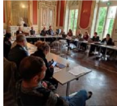
Le comité de pilotage Petite Ville de Demain à Tullins, le 29 septembre 2022.

Une étude pré-opérationnelle d'OPAH-RU se déroule sous maîtrise d'ouvrage du Pays Voironnais, en coordination avec les études d'attractivité résidentielle et d'aménagements des espaces publics portées par la ville. Elle vise à identifier les bâtis prioritaires dans le centre-ville afin d'organiser une réhabilitation des immeubles les plus stratégiques (insalubrité de l'habitat, friches urbaines, vacance et vétusté).