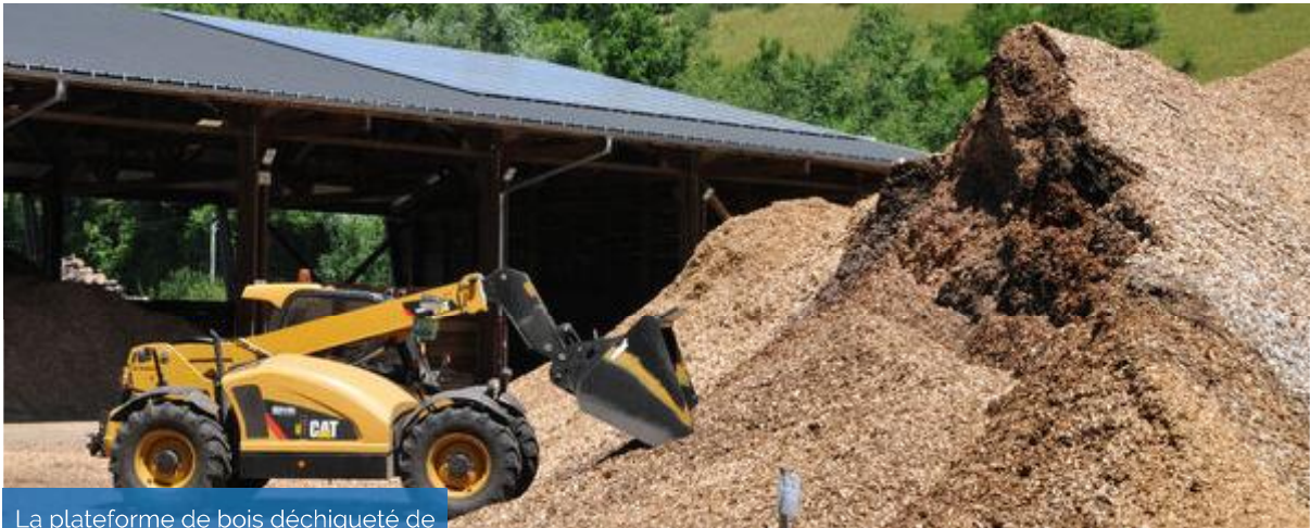
La plateforme de bois déchiqueté de Charavines est un équipement structurant de la filière bois-énergie locale.

Les forêts représentent 30 % du territoire du Pays Voironnais. Dans le contexte actuel, elles sont au cœur de différents défis et enjeux. En plus de leur adaptation au changement climatique, on peut distinguer ce que l'on appelle communément les « 3S » :