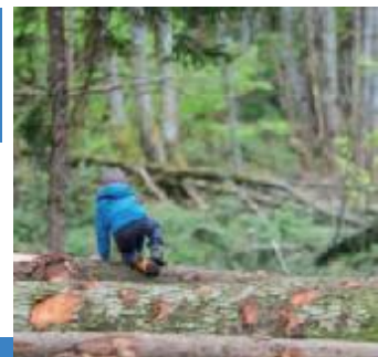
Les forêts couvrent 30% de la surface du Pays Voironnais ce qui en fait un territoire fortement forestier